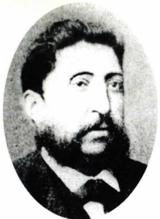
Leon C. Negruzzi (1840 - 1890)