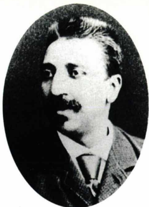
Iacob C. Negruzzi (1842 - 1932)